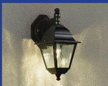
▲壁付け照明器具(例)